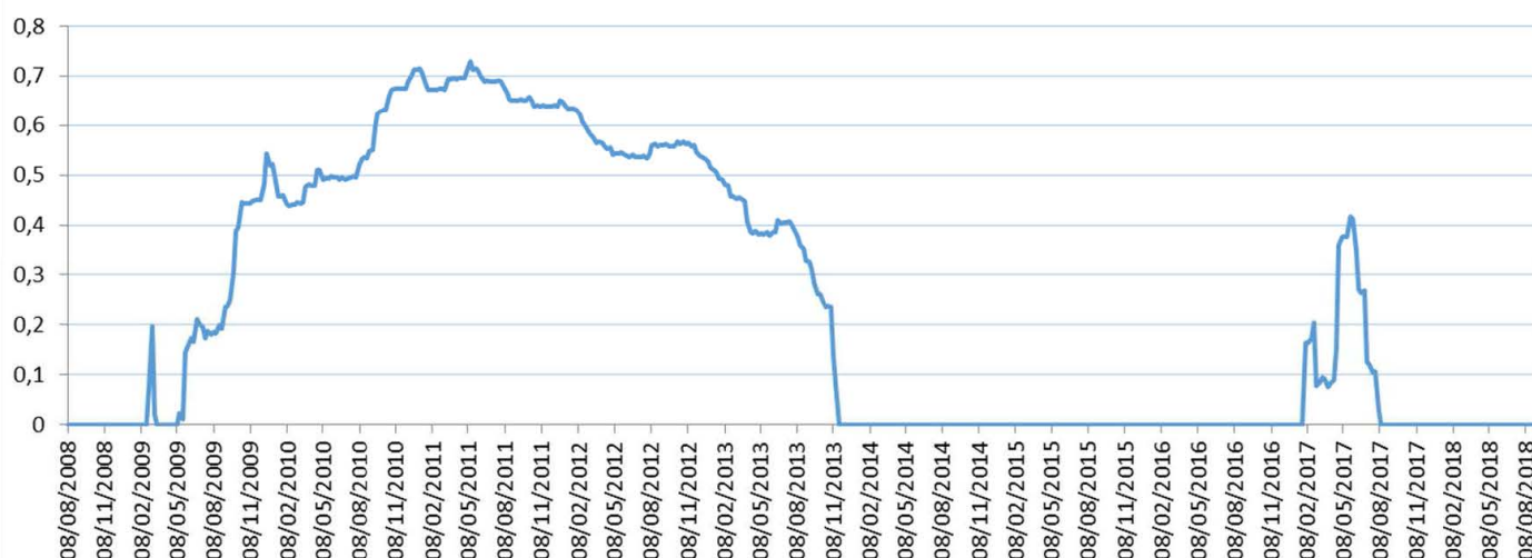
Gráfico: Evolución histórica de la TAE. Se advierte que rentabilidades pasadas no presuponen rendimientos futuros

El gráfico refleja el resultado en términos de TAE que a vencimiento hubiera obtenido el inversor si el lanzamiento del fondo se hubiera producido semanalmente durante los últimos 10 años.