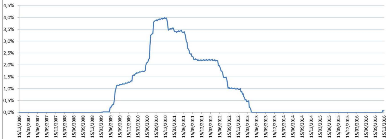
Gráfico: Evolución histórica de la TAE. Se advierte que rentabilidades pasadas no presuponen rendimientos futuros

El gráfico refleja el resultado en términos de TAE que a vencimiento hubiera obtenido el inversor si el lanzamiento del fondo se hubiera producido semanalmente durante los últimos 10 años.