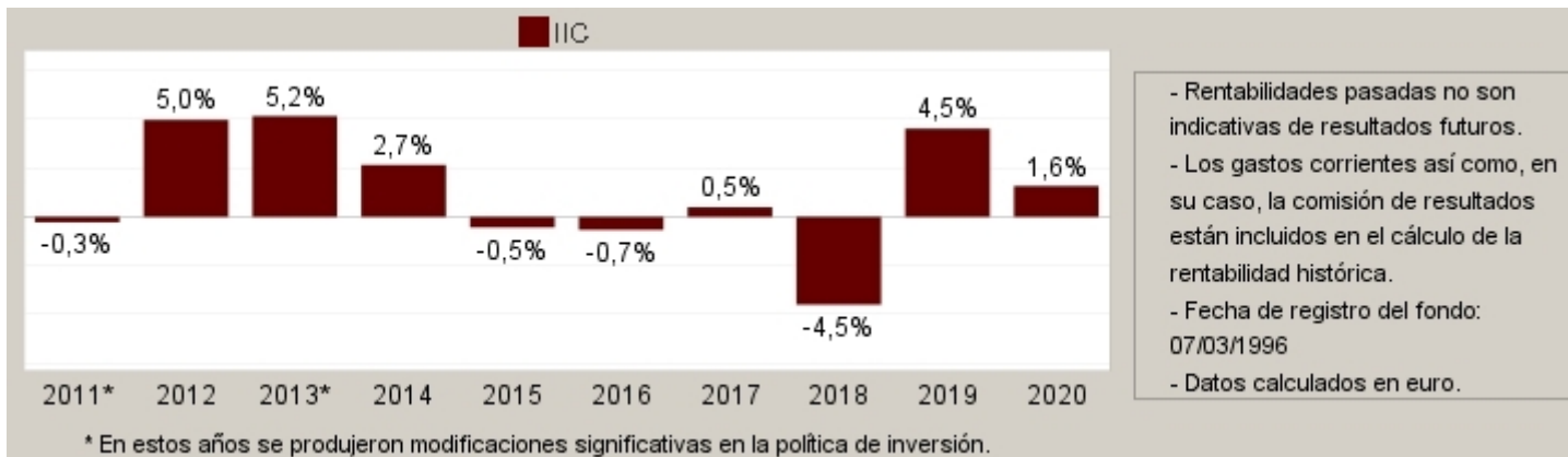
Gráfico rentabilidad histórica

Datos actualizados según el último informe anual disponible.