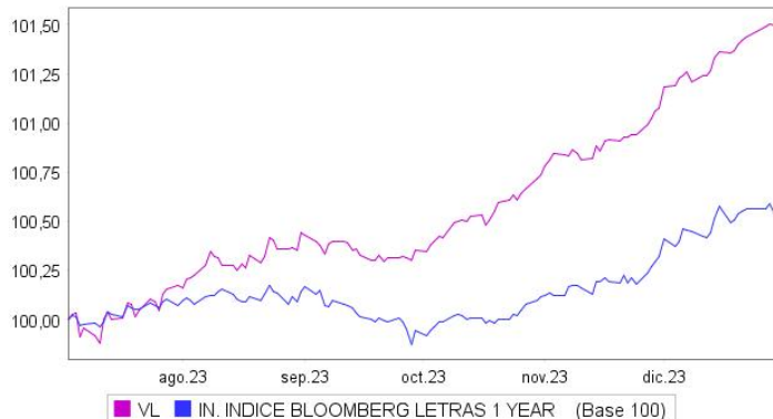
Evolución del Valor Liquidativo