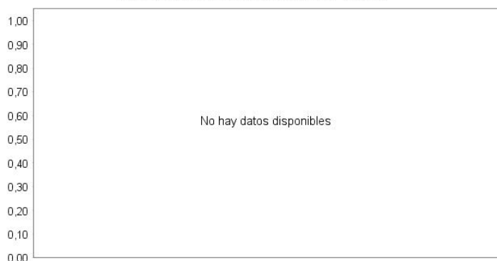
Evolution of the Net Asset Value