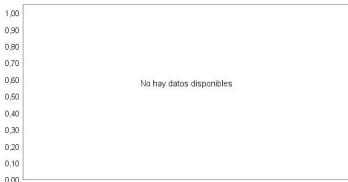
Evolution of the Net Asset Value