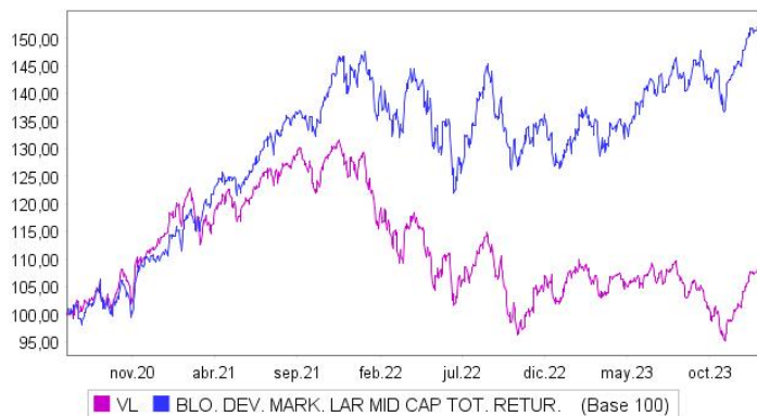
Evolución del Valor Liquidativo