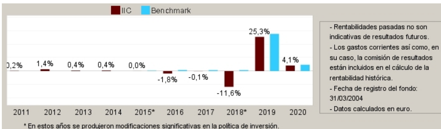
Gráfico rentabilidad histórica

Datos actualizados según el último informe anual disponible.