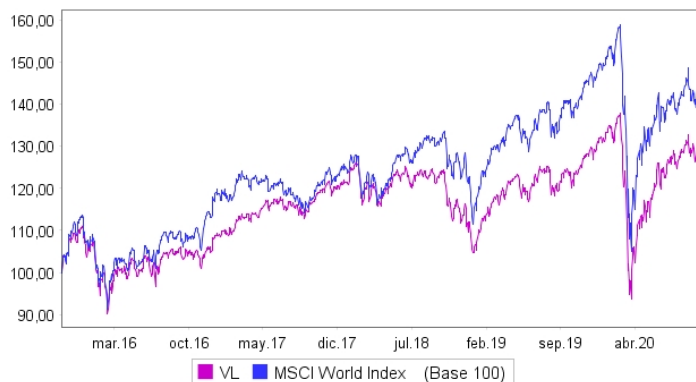
Evolución del Valor Liquidativo