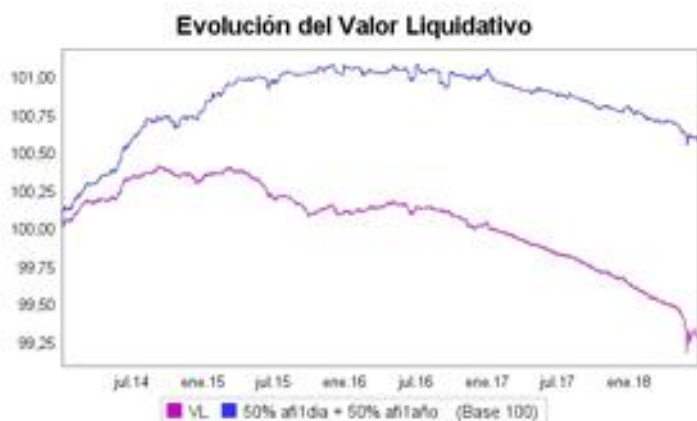
Evolución del valor liquidativo. Últimos 5 años