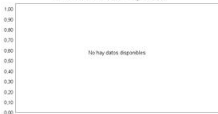
Evolución del Valor Liquidativo