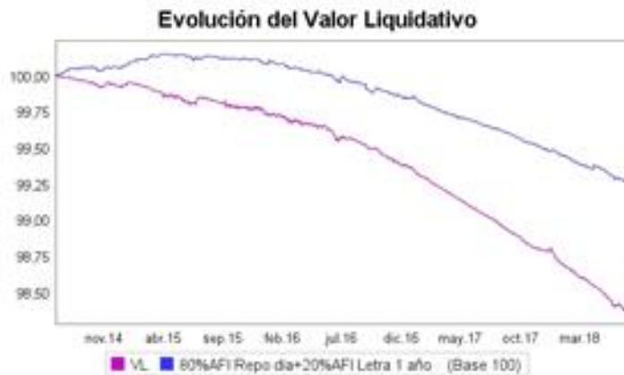
Evolución del valor liquidativo. Últimos 5 años