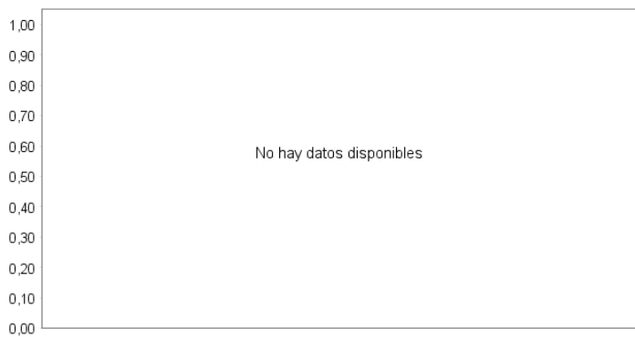
Evolución del Valor Liquidativo